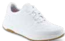
DUNA pág. 2 SANIDAD/HOSTELERÍA