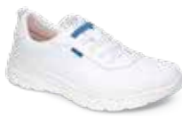
ALICANTE pág. 3 SANIDAD/HOSTELERÍA