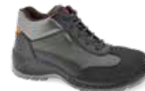
CAIRO pág. 48 SEGURIDAD