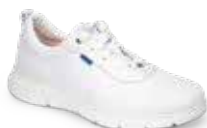
SEUL pág. 11 SANIDAD/HOSTELERÍA