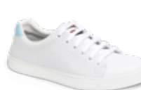
CASUAL pág. 15 SANIDAD/HOSTELERÍA