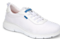
ATLANTA pág. 4 SANIDAD/HOSTELERÍA