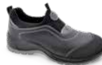
FLEXILE PLUS pág. 52 SEGURIDAD