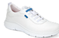
ALTEA PLUS pág. 5 SANIDAD/HOSTELERÍA