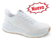
NIMBO pág. 1 SANIDAD/HOSTELERÍA