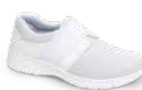
SIENA TEX pág. 14 SANIDAD/HOSTELERÍA