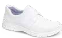
SIENA PERFORADO pág. 13 SANIDAD/HOSTELERÍA