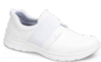
SIENA pág. 12 SANIDAD/HOSTELERÍA